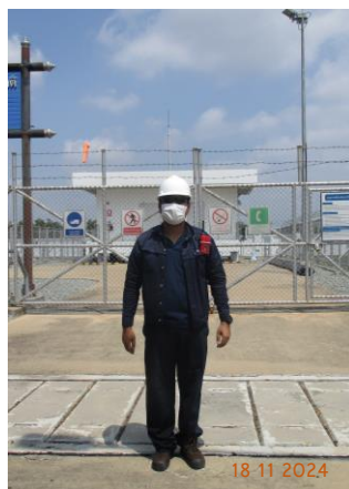
ภาพที่ 2-5 พนักงานสวมใส่อุปกรณ์คุ้มครองอันตรายส่วนบุคคล