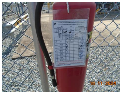
ภาพที่ 2-3 ถังดับเพลิงแบบเคมีผง และ Tag ตรวจสอบถังดับเพลิงแบบเคมีผง