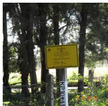
ภาพที่ 2-2 ป้ายแสดงตำแหน่งแนวท่อส่งก๊าซธรรมชาติ