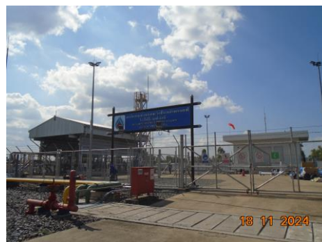
ภาพที่ 2-4 เจ้าหน้าที่รักษาความปลอดภัย บริเวณสถานีควบคุมความดันและวัดปริมาณก๊าซธรรมชาติ (MRS)